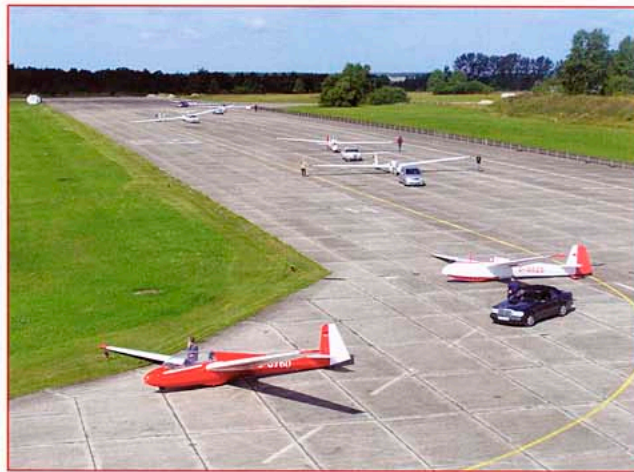
Stendal heeft nog sovjet maatvoering: héél groot!

Air Sports Mail is een uitgave van de Koninklijke Nederlandse Vereniging voor Luchtvaart.