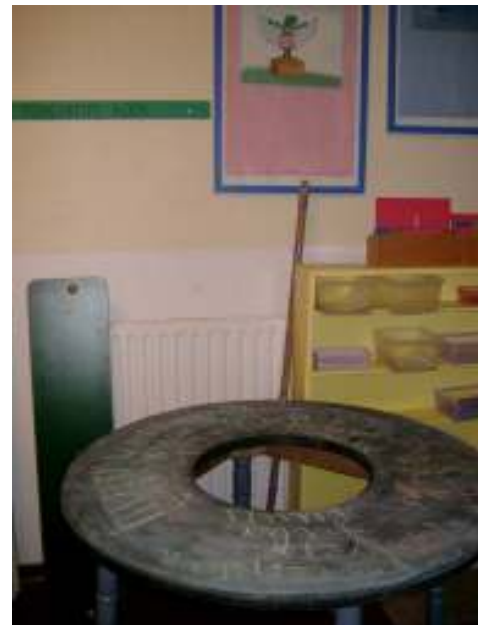
De motoriektafel in de Novoscriphoek

Ook is er op de gang ruimte voor bepaalde vakgebieden, met als doel dicht bij de beleving van kinderen komen. Er is een Novoscriphoek, met een tafel waarop de lateralisatie wordt getest. Ook zijn er zakjes met daarin letters die gevoeld kunnen worden (kinethisch) en een doos waarin het kind de handen in kan stoppen om letters te voelen. Immers, niet alle kinderen leren visueel!