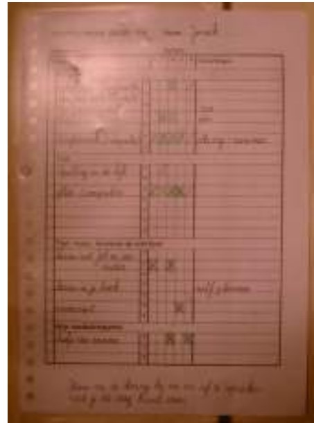
Contractbrief groep 5-6

Het contractwerk met de contractbrief vormt vanaf groep 5-6 een rode draad in het onderwijssysteem op deze school. Doel van deze brief is het leren zelfstandig werken en leren plannen. Op donderdagmorgen wordt in de kring de nieuwe contractbrief ingevuld door de kinderen, samen met de leerkracht. In dit 'contract' staat per vakgebied de 'verplichte' weektaak voor de komende week gespecificeerd en daarbij welke keuzetaken het kind wil gaan doen, bijvoorbeeld projectwerk. Verder speelt de contractbrief in op individuele behoeften van een kind: aan welke stof of welk aspect gaat het kind die week extra aandacht schenken? Dit wordt in samenspraak met de leerkracht én het kind vastgelegd. De kinderen werken gedurende de week grotendeels zelfstandig aan de taken die vermeld staan op hun contractbrief en tekenen af welk werkje klaar is. Sommige taken zijn al op een bepaalde dag ingedeeld, andere taken moeten zelf worden gepland. Op woensdag moet al het werk plus de contractbrief worden ingeleverd. De leerkracht kijkt het werk op woensdagmiddag na en bepaalt met de eventuele duo-partner en leerkracht(en) van de andere groep 5-6 of 7-8 de verplichte weektaken voor de volgende week. Op donderdagmorgen beginnen de kinderen weer met een nieuwe brief.