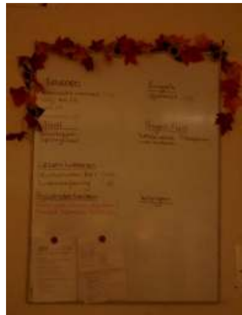
Het takenbord in groep 7-8

In de groepen 5-6 en 7-8 wordt het takenbord steeds beknopter . Er wordt een steeds groter beroep gedaan op het zelfstandig werken door de kinderen. Op individuele behoeftes wordt afgestemd in de wekelijkse contractbrief.