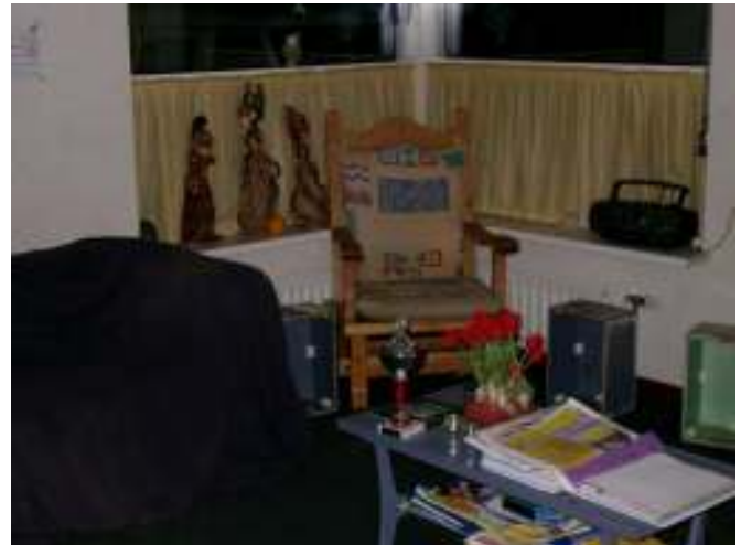
De zithoek in groep 7-8

In ieder klaslokaal, van de kleutergroepen tot en met groep 8, zijn één of meerdere hoeken ingericht. Alle lokalen hebben een bovenverdieping, te bereiken via een trapje, in de klas. Dit levert zowel boven als beneden een knusse hoek op! De hoeken die ik heb gezien tijdens het bezoek zijn: