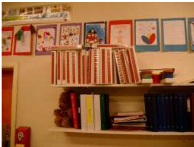
De mappen van ieder kind, hier in groep 7-8

Gezien de doorgaande lijn binnen de basisschool maar ook de vaardigheden die de moderne maatschappij van jong volwassenen verwacht, acht ik zelfstandig kunnen werken en leren plannen een heel goede zaak.