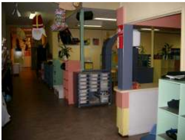
De gangen: gezellig druk

Het moge duidelijk zijn: binnen deze school barst het van de sfeer. En ik denk dat dit niet alleen door het jaar heen het geval is. Alle klassen zijn ruim opgezet, open en gezellig aangekleed en ook de gangen zijn alles behalve kaal. Op de gangen zijn overal hoeken om te spelen (hierover verderop meer) en er hangen ook een hoop prenten aan de muur.