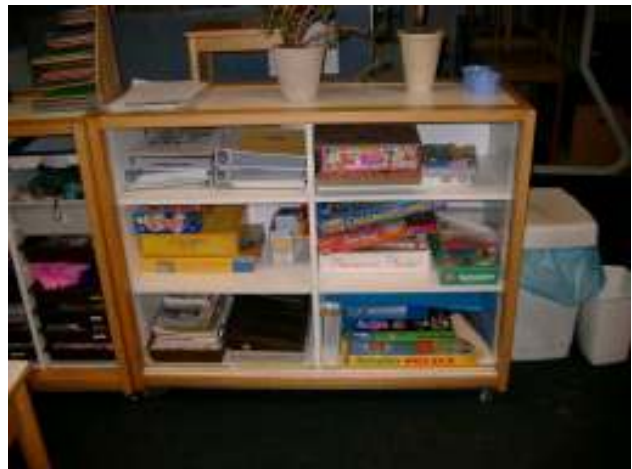
Spelletjeskast groep 7-8

Sowieso wordt het binnen de school veel waarde gehecht aan het samen spelen, in de meest letterlijke zin middels gezelschapsspelen.