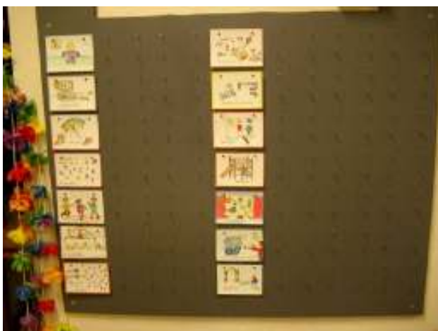
Het planbord in groep 1-2

Aanpassen aan het individuele niveau speelt een grote rol binnen het EGO en binnen deze school. Op deze school proberen ze aan deze voorwaarde voor hoge betrokkenheid tegemoet te komen middels contractwerk en planborden.