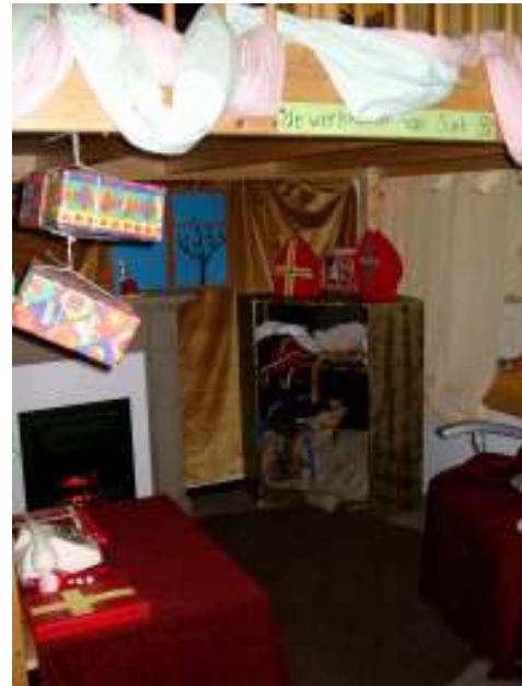
De Werkkamer van de Sint in groep 3-4

In groep 3-4 is in tegenstelling van veel 'normale' scholen geen sprake van een vaste klassenopstelling met een bureau van de leraar en tafels in rijen of groepjes. Er zijn allerlei hoeken afgescheiden in het lokaal door een creatieve opstelling van kasten en borden. In deze hoek staan wat tafeltjes. Zo kunnen kinderen bijvoorbeeld in een bepaalde hoek rekenen, en taal vindt plaats in een andere, vaste hoek van de klas. Er is geen vast schoolbord. In geen enkel klaslokaal, van groep 1-2 tot en met 7-8 is een bureau van de leraar te vinden. Ondanks de afwezigheid van een huishoek of andere typische 'kleuterhoeken' is de eerste indruk van de lokalen van de groepen 3-4 toch die van een kleuterklas. Wat verder nog opviel: er zijn geen getallenlijn of lijnletters aan de muur.