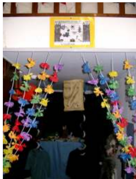
De dierenhoek in groep 1-2

Een wisselhoek, momenteel rond dieren. Er lagen onder andere knuffels, kleding en schmink.