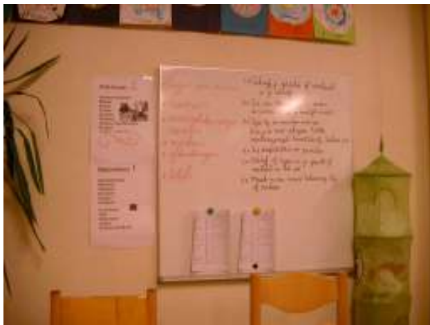
Het takenbord in groep 5-6

In de groepen 5-6 en 7-8 wordt het takenbord steeds beknopter . Er wordt een steeds groter beroep gedaan op het zelfstandig werken door de kinderen. Op individuele behoeftes wordt afgestemd in de wekelijkse contractbrief.