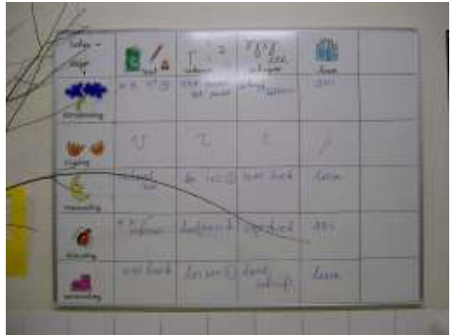
Het takenbord in groep 3-4

Het takenbord in de twee groepen 3-4 is precies hetzelfde qua inhoud, er vindt onderling overleg plaats tussen de leerkrachten omtrent de weektaken. Delen van het planbord zijn op eigen niveau.