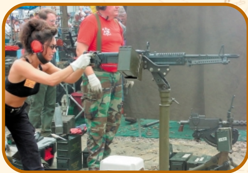
In de VS is schieten een sport, die vrijwel iedereen kan beoefenen.