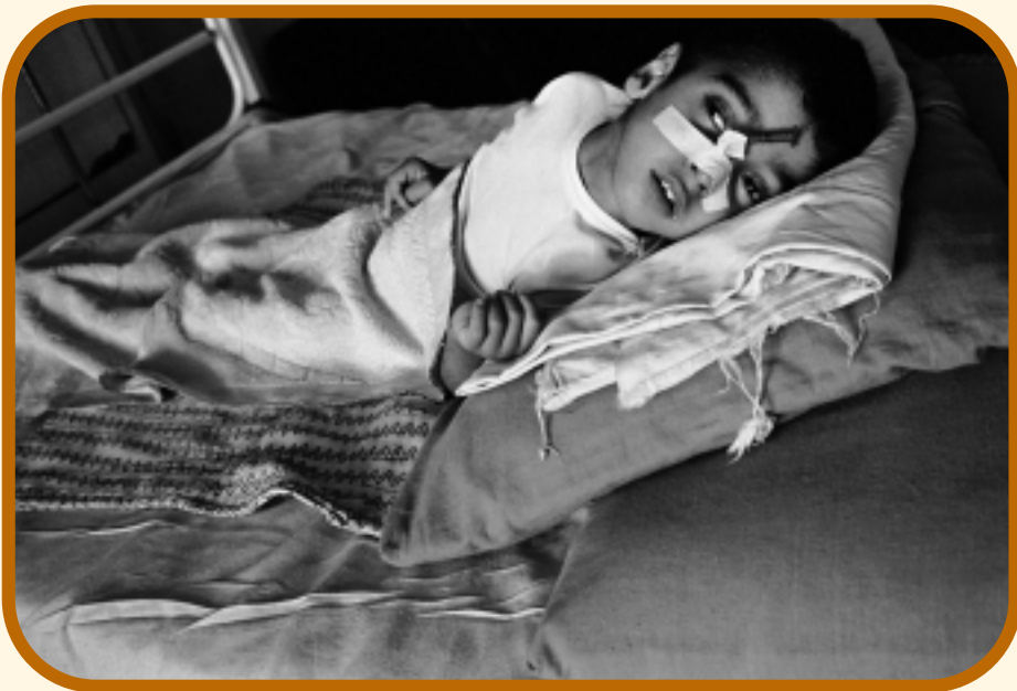
Irakees slachtoffer van tijdens de Golfoorlog door de VS gebruikte radioactieve munitie

den en de neergeslagen radioactieve stofdeeltjes inademen. Ook hier geldt: dit is geen oorlog maar een terroristische slachtpartij. Desondanks zullen in een nieuwe 'oorlog' deze wapens wederom op grote schaal worden gebruikt. De Geneefse Conventies, mensenrechten, humanisme, democratie spelen daarbij geen enkele rol; het gaat immers om geld. En dit laatste voert ons naar de Wet van Maxim. Die luidt aldus: hoog technologisch wapentuig wordt door de marktwerking steeds goedkoper waardoor het in toenemende mate binnen het bereik komt van steeds meer staten. We zien een onvermijdelijk proces van kleiner, goedkoper en effectiever met als gevolg dat oorlogsmateriaal zich verspreidt als olie op water en elke technologische voorsprong onherroepelijk tenietgaat. De veronderstelling dat massavernietigingswapens in handen van een enkele grootmacht kunnen blijven is onjuist. Dat bewezen de Duitsers