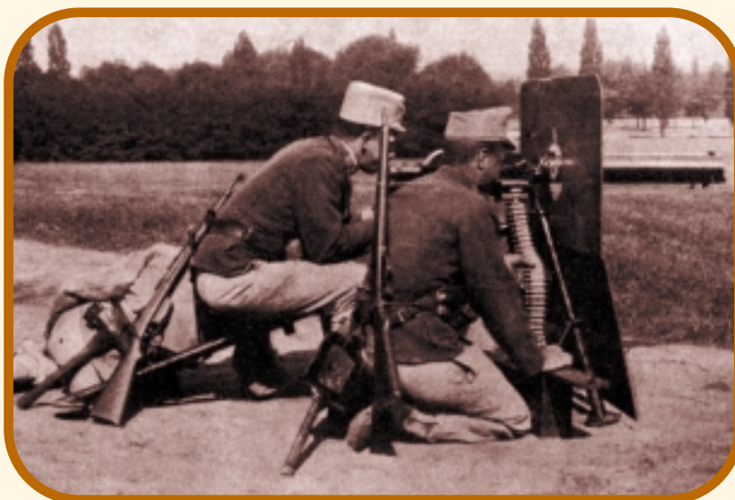
Vechten met de 'wapens van de beschaving'

ren. Zo schrijft hij over 'de zon die op vele duizenden vijandige speerpunten schitterde' en over 'een groot aantal ongelukkige burgers dat werd gedood en verwond', over 'vele gruwelijke wraakoefeningen' van het Britse leger, deze 'soldaten van wetenschappelijke oorlogsvoering,' over Europese militairen uitgerust met 'de wapens van de beschaving', die werden ingezet tegen 'deze grote horde meedogenloze wilden' van meer dan 50.000 krijgers, die over een open vlakte naar de Britse linies oprukten. Tafereelen die hem aan 'de oude afbeeldingen van de kruisvaarders op het tapijt van Bayeux' deden denken. 'Het was een gruwelijk gezicht, want tot nu toe hadden ze ons nog geen enkel letsel toegebracht, en het leek een onrechtvaardig voordeel om zo wreed toe te slaan terwijl ze daarop geen antwoord konden geven. Niettemin keek ik van nabij vanuit een comfortabele positie uiterst zorgvuldig naar het effect van het vuren... en liet het verdere verloop van de strijd over aan de infanterie