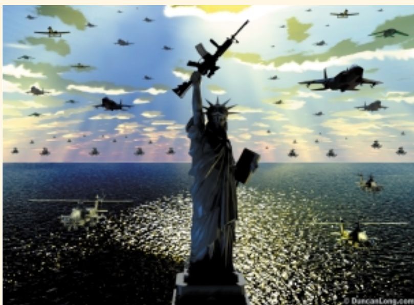
...We have got the Maxim Gun and they have not...

overmacht. Hoe diep de baron die dag in Soedan onder de indruk moet zijn geweest, bleek zestien jaar later, toen de Duitsers vanuit hun loopgraven met een eigen kopie van de Maxim gun hele divisies Britse infanteristen met evenveel gemak wisten te doden. Richten was niet nodig, ze hoefden slechts de trekker over te halen en