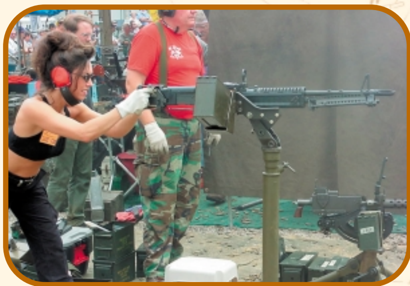
In de VS is schieten een sport, die vrijwel iedereen kan beoefenen.