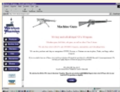
Machinegeweren zijn via internet te koop

al in 1916 met hun Maschinengewehr 08 en dit feit wordt nu opnieuw aangetoond door de proliferatie van nucleaire wapens. Israël bijvoorbeeld beschikt erover, de VS gedooft dat, met als gevolg dat ook andere landen in de regio zich genoodzaakt zien om dergelijke terroristische wapens te ont-