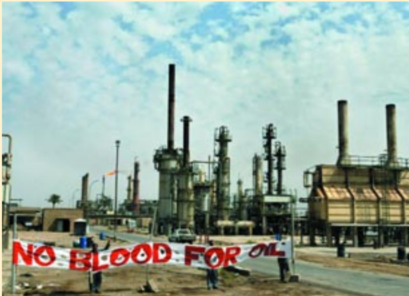
Werknemers van de Doura-raffinaderij bij Bagdad demonstreren tegen de oorlog (7 maart 2003)

Hoewel het Amerikaanse bedrijfsleven altijd al politici kocht, was ditmaal vooral de olie en energiesector succesvol. Zo was het energieconcern Enron, door grootschalige corruptie failliet gegaan, de grootste financier van de politieke ambities van het koppel Bush/Cheney. Dat het om grote bedragen gaat blijkt wel uit het feit dat Halliburton sinds 1992 meer dan 1,6 miljard dollar in verkiezingscampagnes van Congresleden investeerde. Tijdens zijn vijfjarig directeurschap van deze maatschappij ontving vice-president Cheney 45 miljoen dollar aan honorarium en aandelen. Daarnaast ontving hij als afscheidsgift twintig miljoen dollar in de vorm van extra aandelen in dit oliedienstverle-