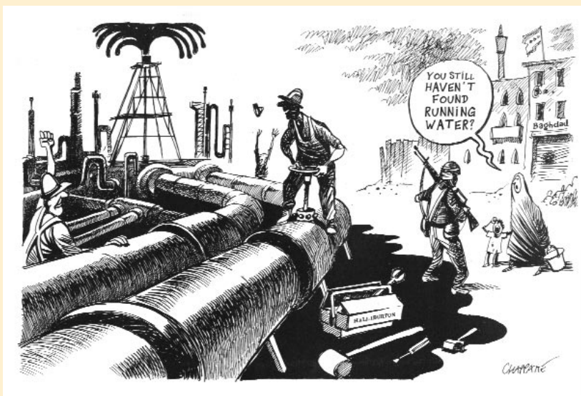
[Cartoon:] Patrick Chapatte/Globecartoon.com

september 2001 berichtte The Wall Street Journal het volgende: 'Wanneer de VS zijn defensiebudget verhoogt in verband met zijn missie een einde te maken aan de terroristische activiteiten die Osama bin Laden ten laste worden gelegd, zal daar iemand geheel onverwacht van mee profiteren: de familie van meneer Bin Laden... De puissant rijke Saoedische clan... heeft geïnvesteerd in een aandelenfonds dat werd ingesteld door de Carlyle Groep, een handelsbank uit Washington met goede connecties, die zich specialiseert in het opkopen van defensie- en ruimte-