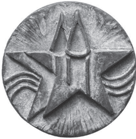
Basilica Stella Maris , 2008, opdracht, gietpenning, brons, 70 mm, brongietterij Art and Craft Vroenhoven (België). Genummerde gelimiteerde oplage.

De monumentale Romaanse Onze-Lieve-Vrouwe-Sterre-der-Zee in Maastricht was in 2008 op de kop af 75 jaar geleden tot basiliek verheven. De kerk dateert uit de elfde eeuw en in